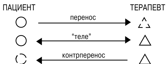
Рис. 8.1. Различные типы взаимоотношений между терапевтом и пациентом

На рис. 8.1. я попытался изобразить в простой, схематичной манере направления межличностных отношений в переносе, контрпереносе и “теле”.